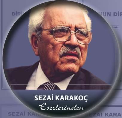
SEZAI KARAKOÇ Eserlerinden