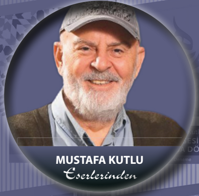
MUSTAFA KUTLU Eserlerinden